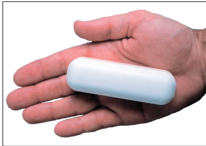
Abb. 1 Ca-PILL® „biologische“ Kalziumpille

Die Befunde wurden zunächst mit Hilfe des natürlichen Logarithmus umgeformt, um sie einer Normalverteilung anzunähern. Die Beschreibung der Befunde (deskriptive Statistik) erfolgte durch geometrische Mittelwerte und Standardfehler (8) für Fall- und Kontrollgruppe. Danach wurde mittels Varianzanalyse (9) geprüft, inwiefern sich Fall- und Kontrollgruppe unterschieden (induktive Statis-